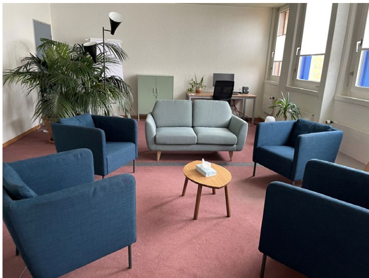
Salle Entretiens de couple et Groupe de parole au Grand-Pré

29 couples ont été suivis au Grand-Pré en 2023 (13 en 2022) avec un total de 114 entretiens (38 en 2022) et 44 entretiens individuels. Les couples ont été orientés par le réseau (10), par les professionnel·les du Centre d'accueil MalleyPrairie et du Centre Prévention de l'Ale (10), ou ont eu connaissance de la prestation sur internet et dans les médias (9).