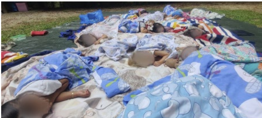
Les Piccolinos en sieste dans une clairière au bord de la Broye, juillet 2023

La Prairie, la garderie pour les enfants des femmes hébergées au Centre d'accueil a, quant à elle, accueilli en moyenne 8 enfants par mois pour 10 places d'accueil par jour avec un pic d'accueils entre avril et juillet, où le 100% de taux de fréquentation a parfois été atteint.